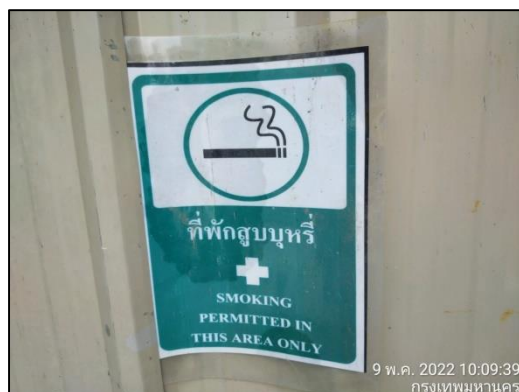
ภาพที่ 10 พื้นที่สูบบุหรี่