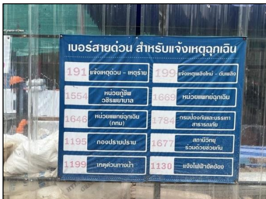
ภาพที่ 5 เบอร์โทรสายด่วนแจ้งเหตุฉุกเฉิน