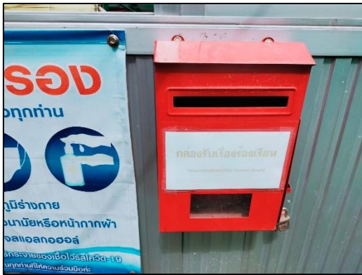
ภาพที่ 19 กล่องรับเรื่องร้องเรียน