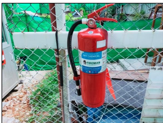
ภาพที่ 9 ถังดับเพลิง