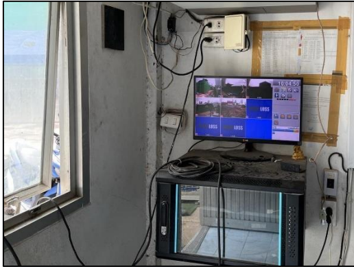
ภาพที่ 17 ห้องควบคุมกล้องวงจรปิด