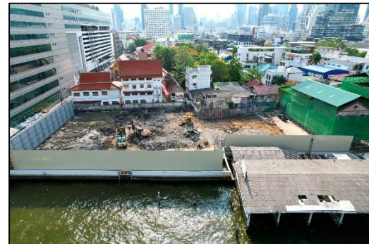
ภาพที่ 20 ภาพมุมสูงโครงการ