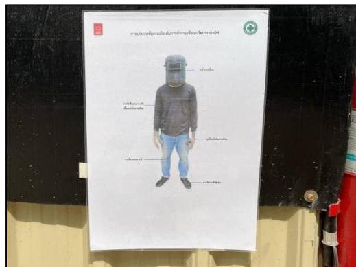
ภาพที่ 6 ป้ายแนะนำการแต่งกายในการทำงานเชื่อม