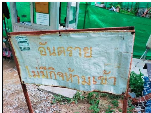
ภาพที่ 24 ป้ายห้ามเข้าโครงการ