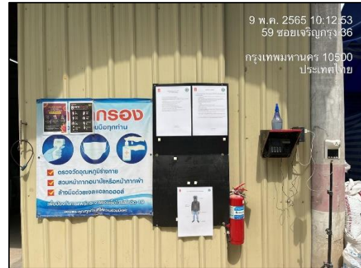
ภาพที่ 18 จุดคัดกรอง Covid-19