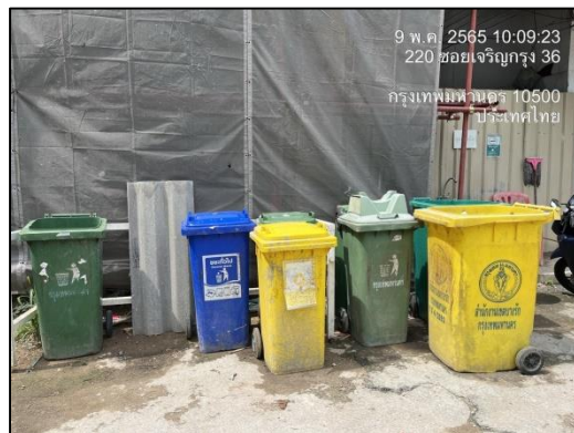
ภาพที่ 8 ถังขยะ