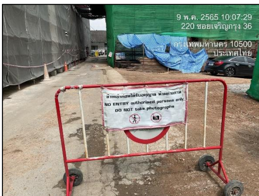
ภาพที่ 21 ที่กั้นทางเข้า-ออกโครงการ