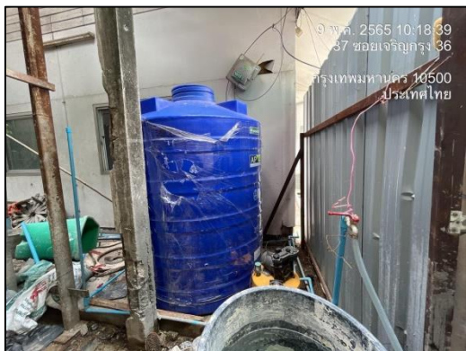
ภาพที่ 7 ถังสำรองน้ำใช้